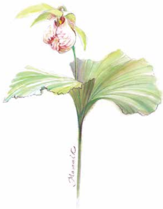
熊谷草 (くまがいそう)