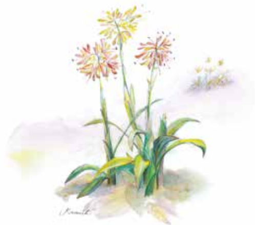
狸々袴 (しょうじょうばかま)